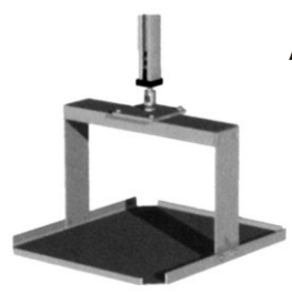
Półka do projektora